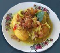
Warung Dhun Adhun Imah Lokasi: daerah Sampang