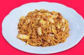
Mie Wak M