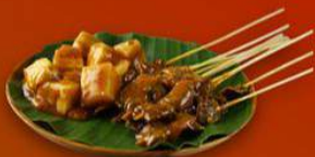
Sate Danguang nan Lamo

Lokasi: Jalan Jenderal Sudirman, Kelurahan Daya Bangun, Kec. Payakumbuh Barat.