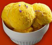
Es Durian Ganti nan Lamo

Lokasi: Jalan Jenderal Sudirman, Kelurahan Daya Bangun, Kec. Payakumbuh Barat.