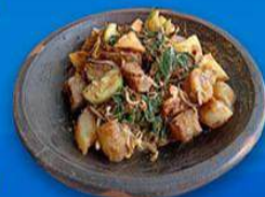
Rujak Cingur Genteng Durasim Lokasi: Jalan Genteng Durasim Nomor 29, Kec. Genteng.