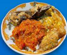
Sego Sambel Mak Yeye Lokasi: Jalan Jagir Wonokromo Wetan No.10, Jagir Wonokromo