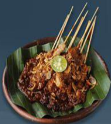
Sate Ayam Madura Cak Is Lokasi: Perempatan Desa Labang, dekat Suramadu.