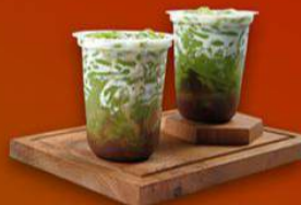
Es Cendol Pattimura

Lokasi: Jalan Khatib Sulaiman No. 63, Padang Utara.