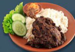
Warung Bebek Sinjay Lokasi: Jalan Raya Ketengan Nomor 45, Bangkalan.