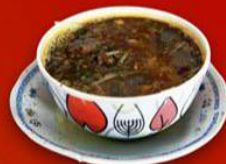
Soto Simpang Karya

Lokasi: Jalan Hos. Cokroaminoto No. 31B, Kampung Pondok, Kec. Padang Barat.