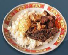
Warung Gang Amboina Lokasi: Jalan KH Moh. Kholil Gg IX Pasarkapok Timur, Demangan.