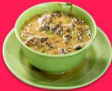
Soto Sinar Pagi